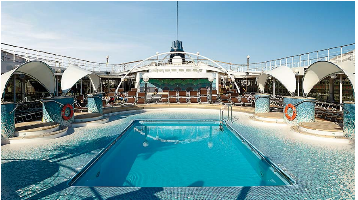
MSC Cruises סיפון הבריכה צילום - MSC Orchestra