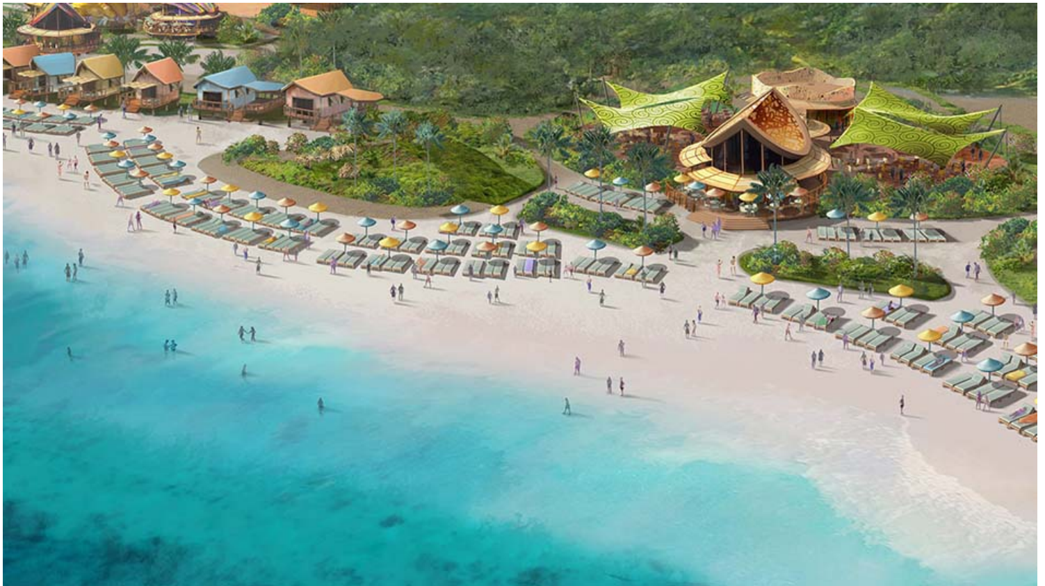
Lighthouse Point: חוף בלעדי למבוגרים. הדמיה דיסני קרוז ליין