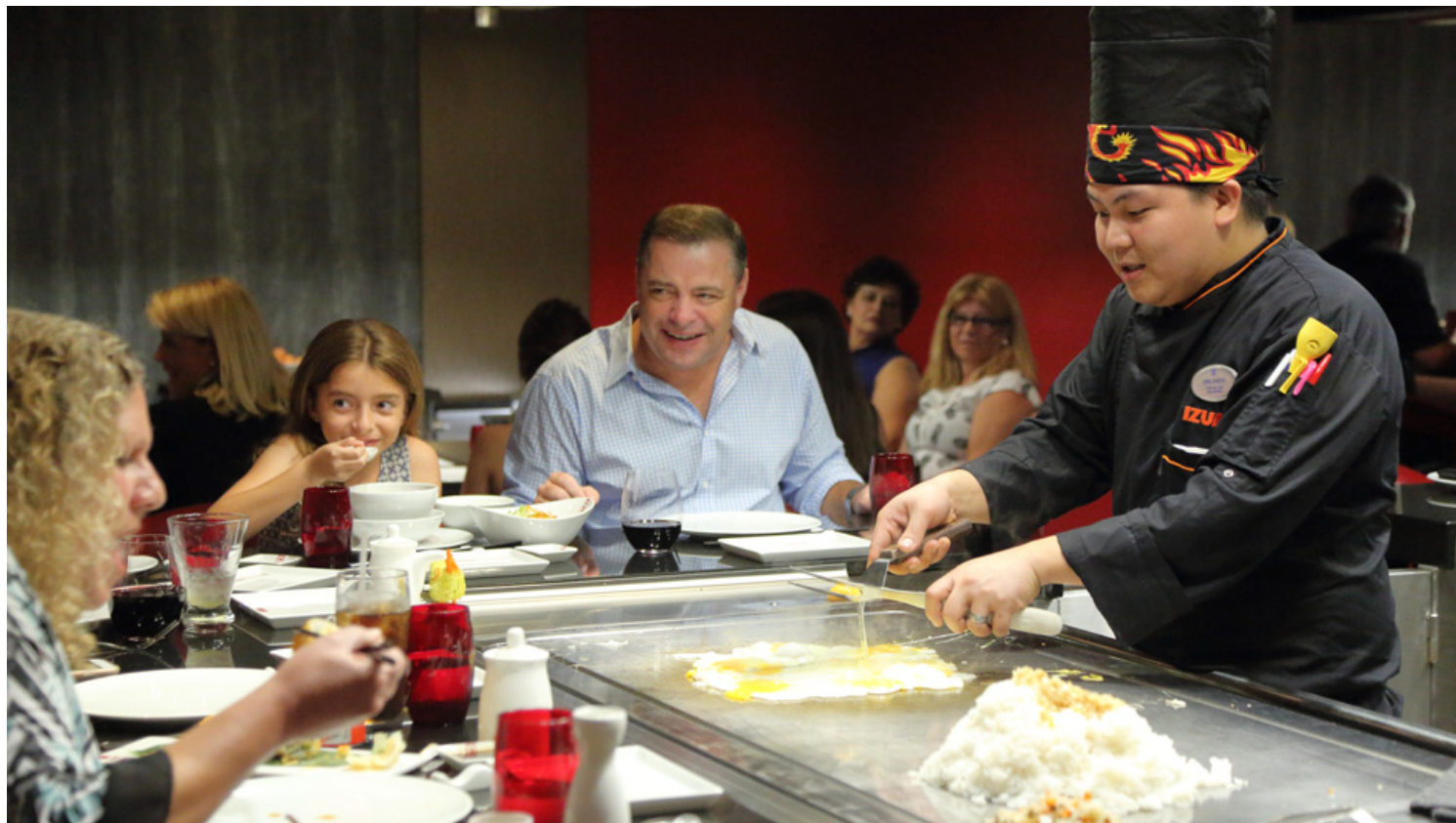
Izumi Hibachi and Sushi - המקום לאוהבי המטבח האסיאתי.

בנוסף, יש אוסף של יותר מתריסר סוגי וויסקי ומגוון משקאות אלכוהוליים דרומיים, כמו מנטה ג'ולפ עם אבקת סוכר ואור הירח של מיסיסיפי העשוי מאוכמניות, פטל שחור ולימונדה.