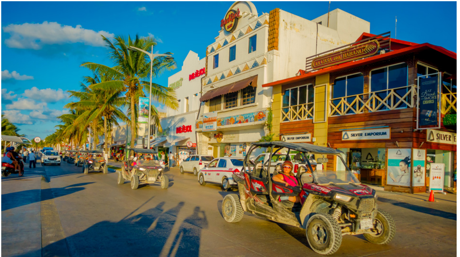
סן מיגל: העיר המרכזית בקוואמל הממוקמת על חוף הים . סיור בסן מיגל

העיר המרכזית בקוואמל הממוקמת על חוף הים בצדו המערבי של האי מול פלאיה דל כרמן. חוף ים, קניות ומסעדות. מוזיאון העיר (Museo de la Isla de Cozumel) מספר את ההיסטוריה של האי, כולל מוצגים מתקופת המאיה והשלטון הספרדי. גם תרבות וגם קצת מזגן ביום חם לא יזיקו.