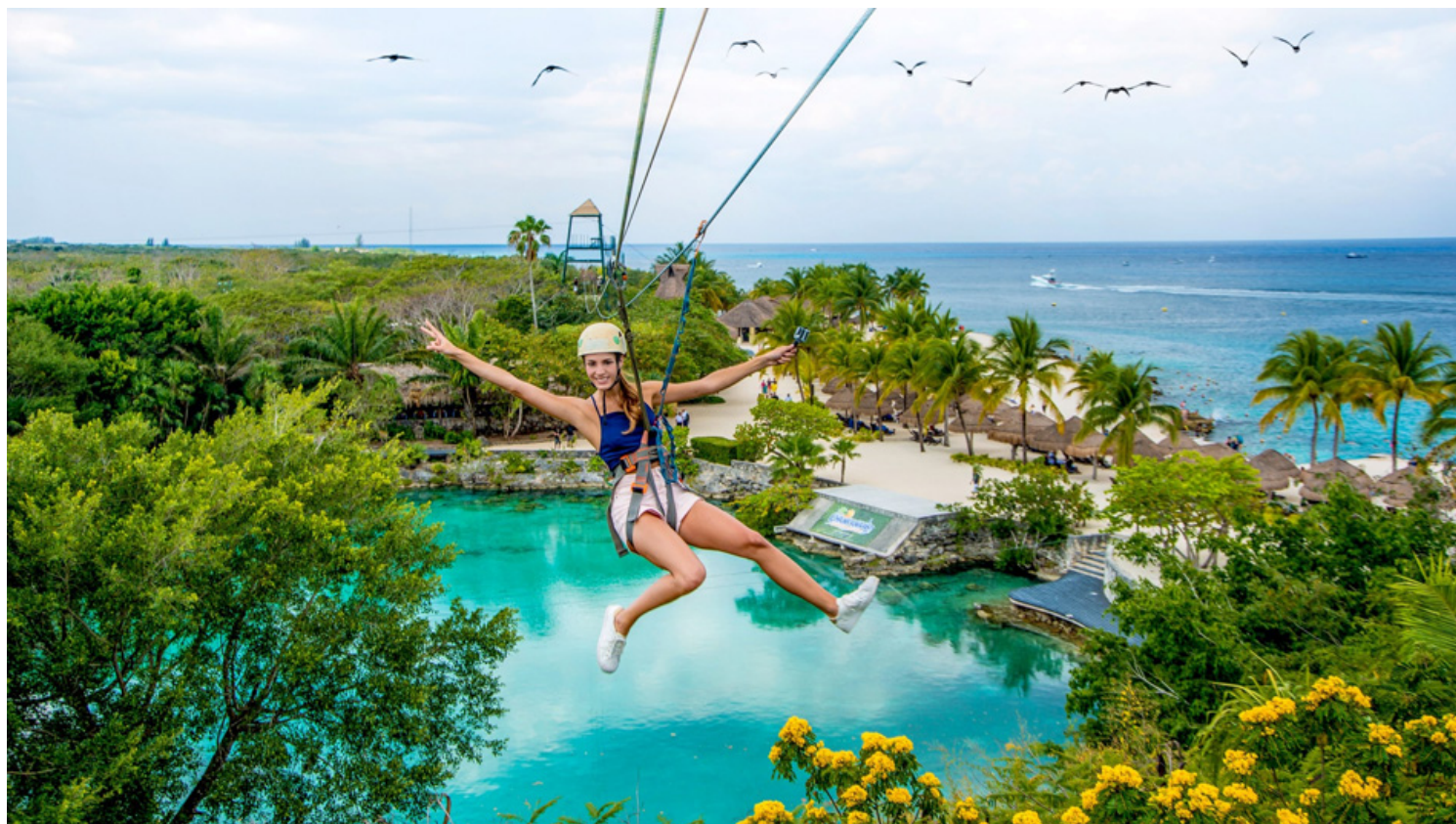
Chankanaab Park: אומגה ועוד המון פעילויות.

הפארק הענק ממוקם כ-10 דקות מטרמינל הנמל ומציע מגוון רחב של פעילויות: חוף גדול הנמצא לצד צוק סלעי, מים צלולים ואידיאלים לצלילת שנורקל. במקום ניתן ליהנות גם מבריכה, מסעדות, מרכז דולפינים ואריות ים, טיול בטבע ועוד. מחיר כניסה כ-20$ ותוספת מחיר לשחייה עם דולפינים, אומגה ועוד.