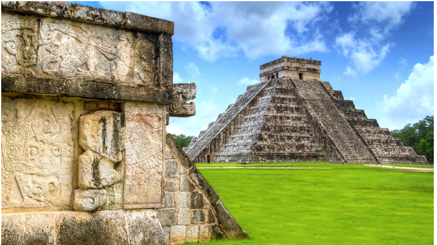
צ'יצ'ן איטצ'ה: והאתר הגדול מכולם לעתיקות המאיה. צ'יצ'ן איטצ'ה (Chichen Itza)

נחשב לאחד משבעת פלאי עולם והאתר הגדול מכולם לעתיקות המאיה. ממוקם במרחק של כשלוש שעות מהנמל. דורש סיור של יום שלם ופחות מתאים לילדים.