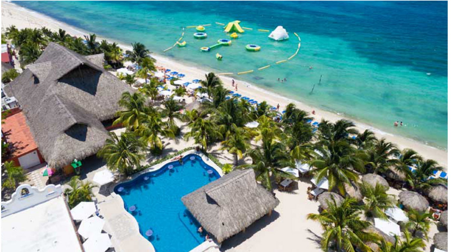
Mr. Sanchos Beach Club: מועדון חוף בסגנון הכל כולל. פינת חוף יפה וחינמית

המקום פועל בימים שני 9 שבת בין השעות 8:00 ל-17:00.