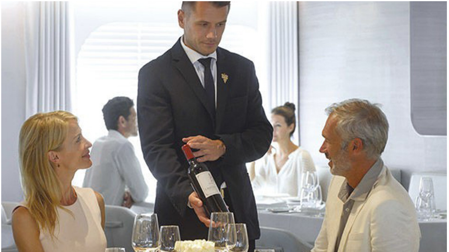
פוננט: קולינריה ברמה עילית. אפריקה והאוקיינוס ההודי

חברת השייט הצרפתית תפעיל 9 מסלולים חדשים לאורך קו החוף האפריקני עם נקודות ציון במצרים, ישראל, האיים הקנריים והים האדום.