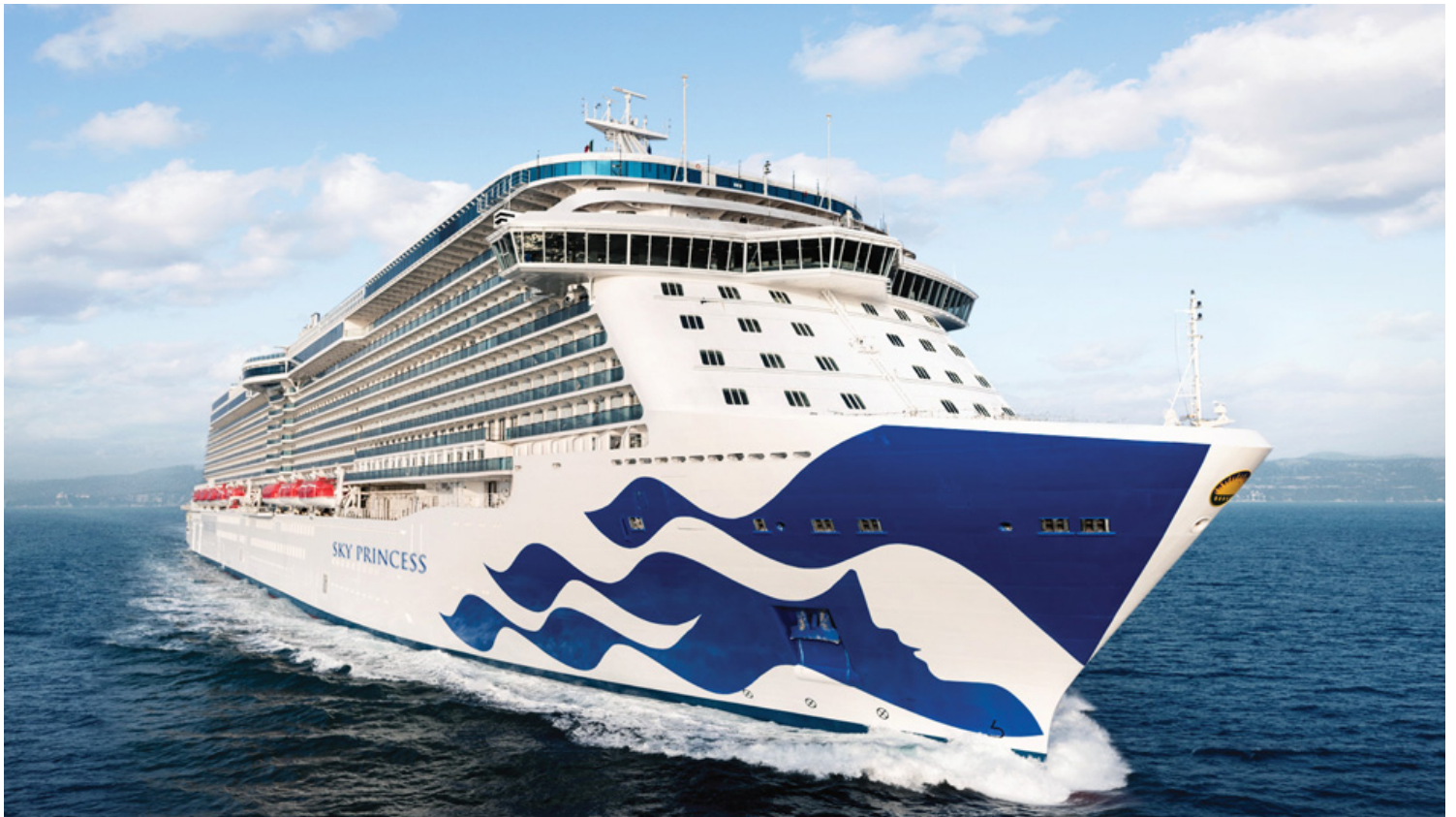
סקיי פרינסיס: במשקל 143 אלף טון ותארח 3,560 נוסעים. אודות פרינסיס קרוזס

פרינסיס קרוזס נוסדה ב-1965 עם אנייה אחת שהפליגה למקסיקו, כיום היא חברת הקרוזים השלישית בעולם עם צי של 17 אניות. מארחת כ-1.7 מיליון נוסעים בשנה במסלולי שיט הנעים בין 3 ל-114 ימים מסביב לגלובוס.