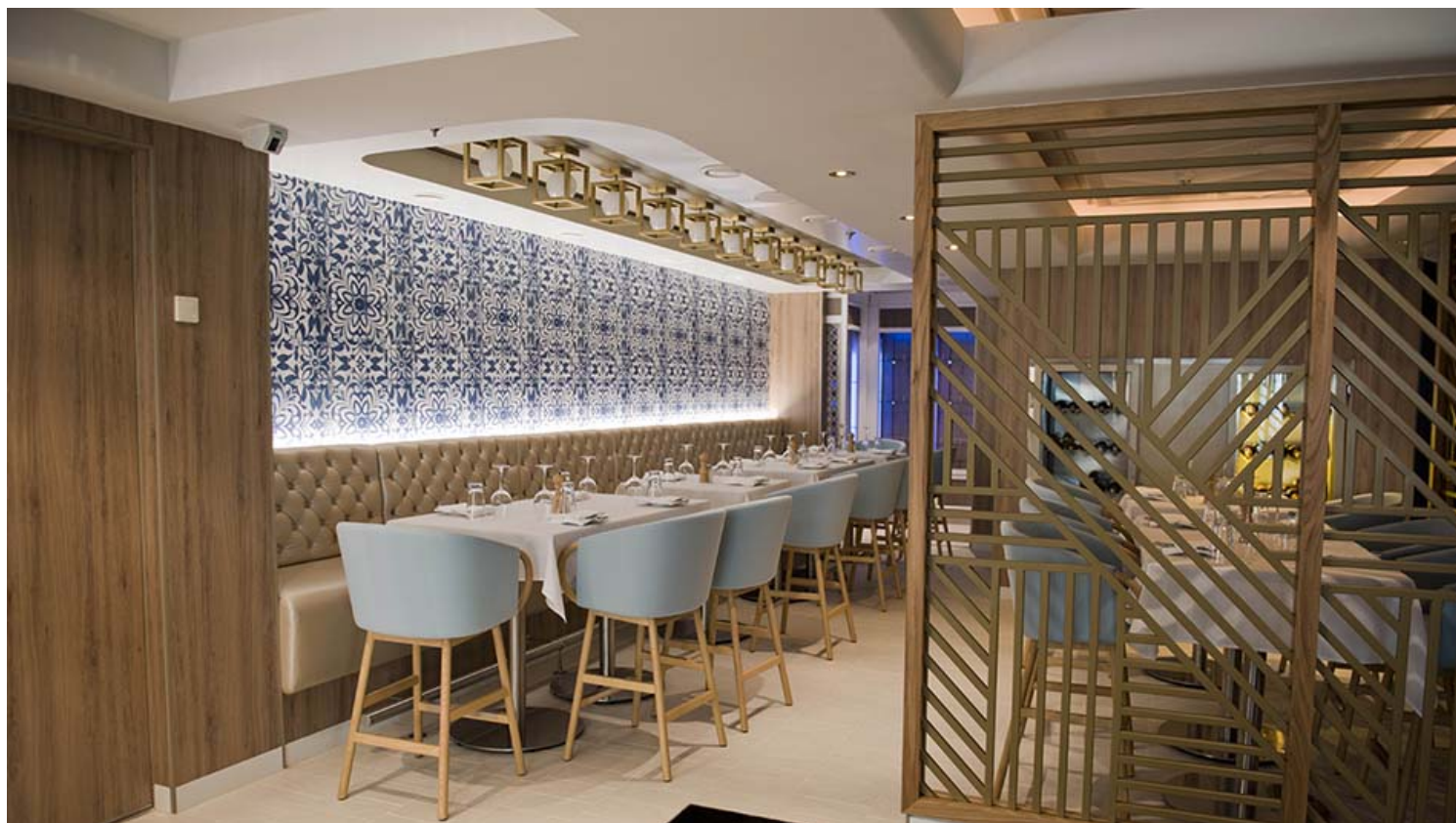
La Cucina: מסעדת Norwegian Dawn. ברוכים המצטרפים לקבוצת הפייסבוק " קרוז חלום של הפלגה " הייחודית בעולם הקרוזים