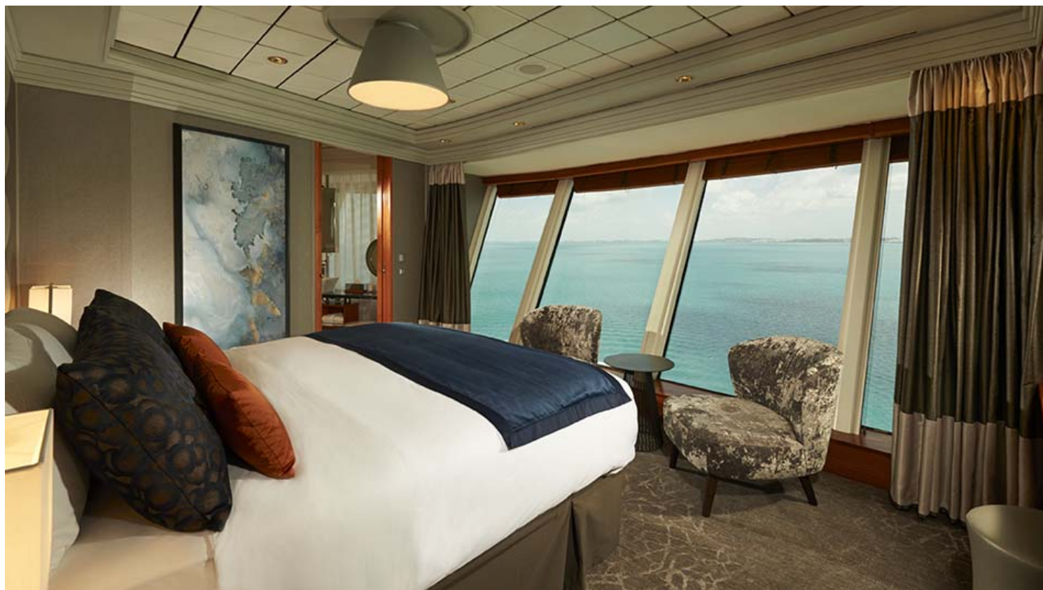
Norwegian Dawn: חדר ב-Garden Villa במתחם The Haven.