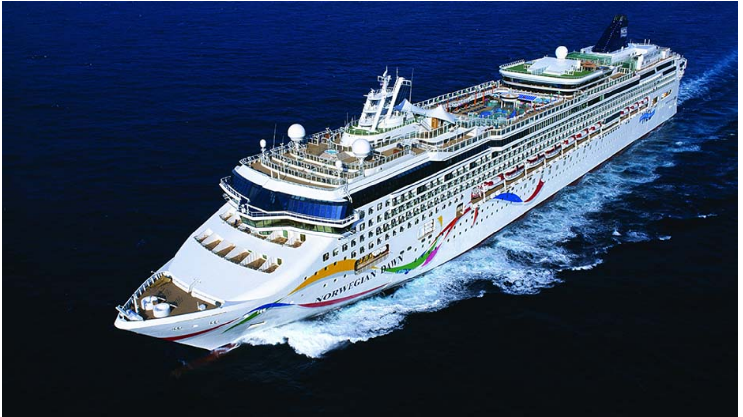
Norwegian Dawn.

Dawn באזור, בחורף 2024. האונייה המארכת 2,340 נוסעים, תפליג מנמל הבית של קייפטאון, דרום אפריקה ופורט לואיס, מאוריציוס, ותציע סדרת הפלגות יוצאות דופן בין ינואר למרץ 2024.