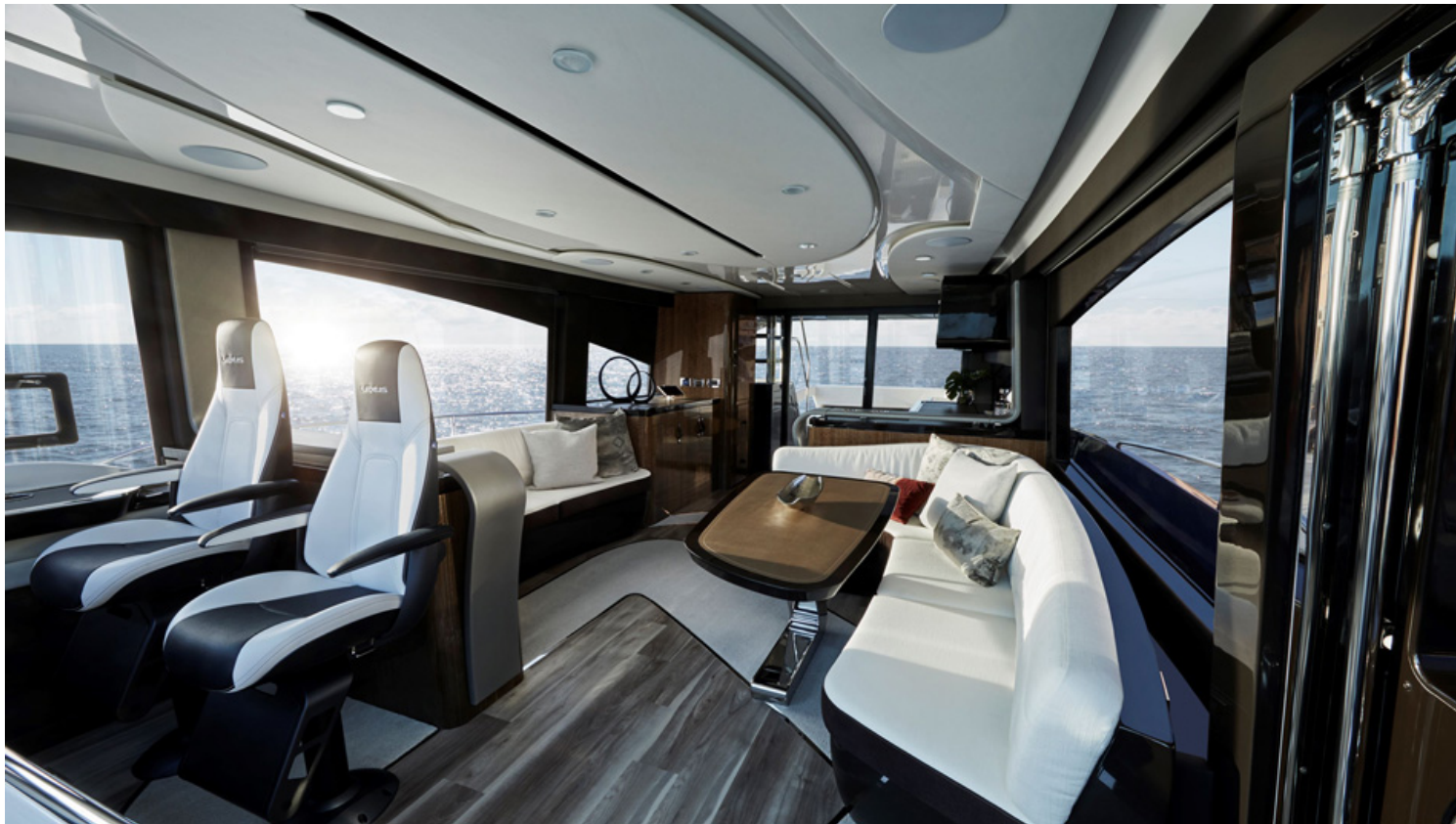
לקסוס LY650: הסלון ביאכטה.