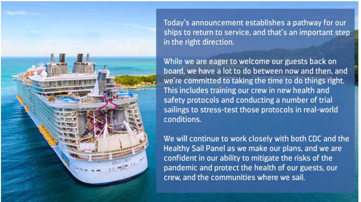
הודעת רויאל קריביאן בדף הפייסבוק

לקהילות בארה"ב, ולהגן על בריאות הציבור ובטיחותו. לאחר פקיעת הצו ב- 31 באוקטובר 2020, CDC תנקוט בגישה מדורגת לחידוש פעילות אוניות הקרוזים במימי ארה"ב", נכתב בהודעת המרכז לבקרת מחלות ומניעתן של ארה"ב.