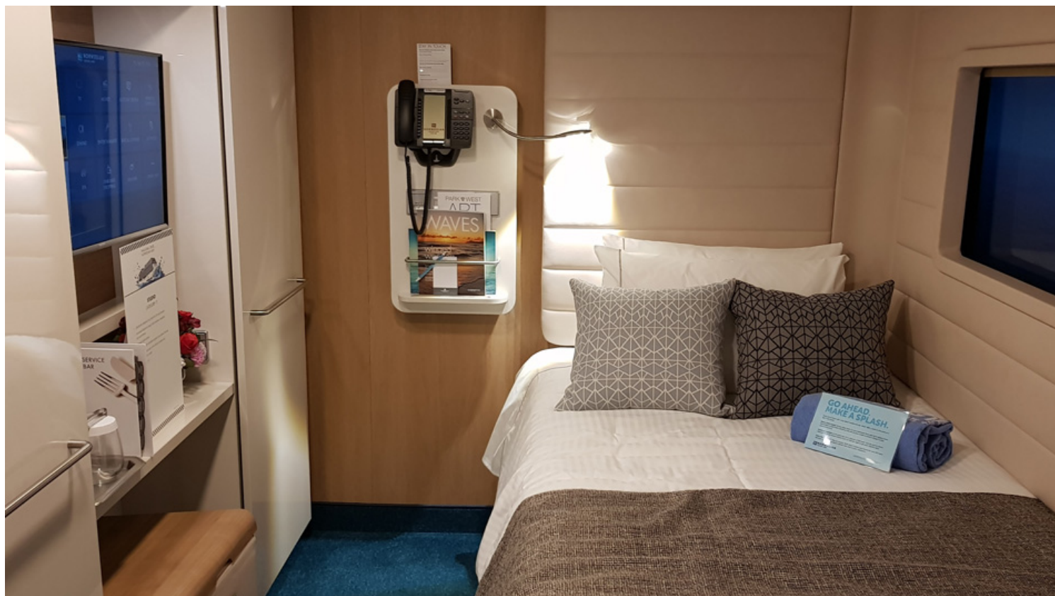
חדר סינגל ב-NCL BLISS.

ברוכים המצטרפים לקבוצת הפייסבוק "קרוז חלום של הפלגה" הייחודית בעולם הקרוזים