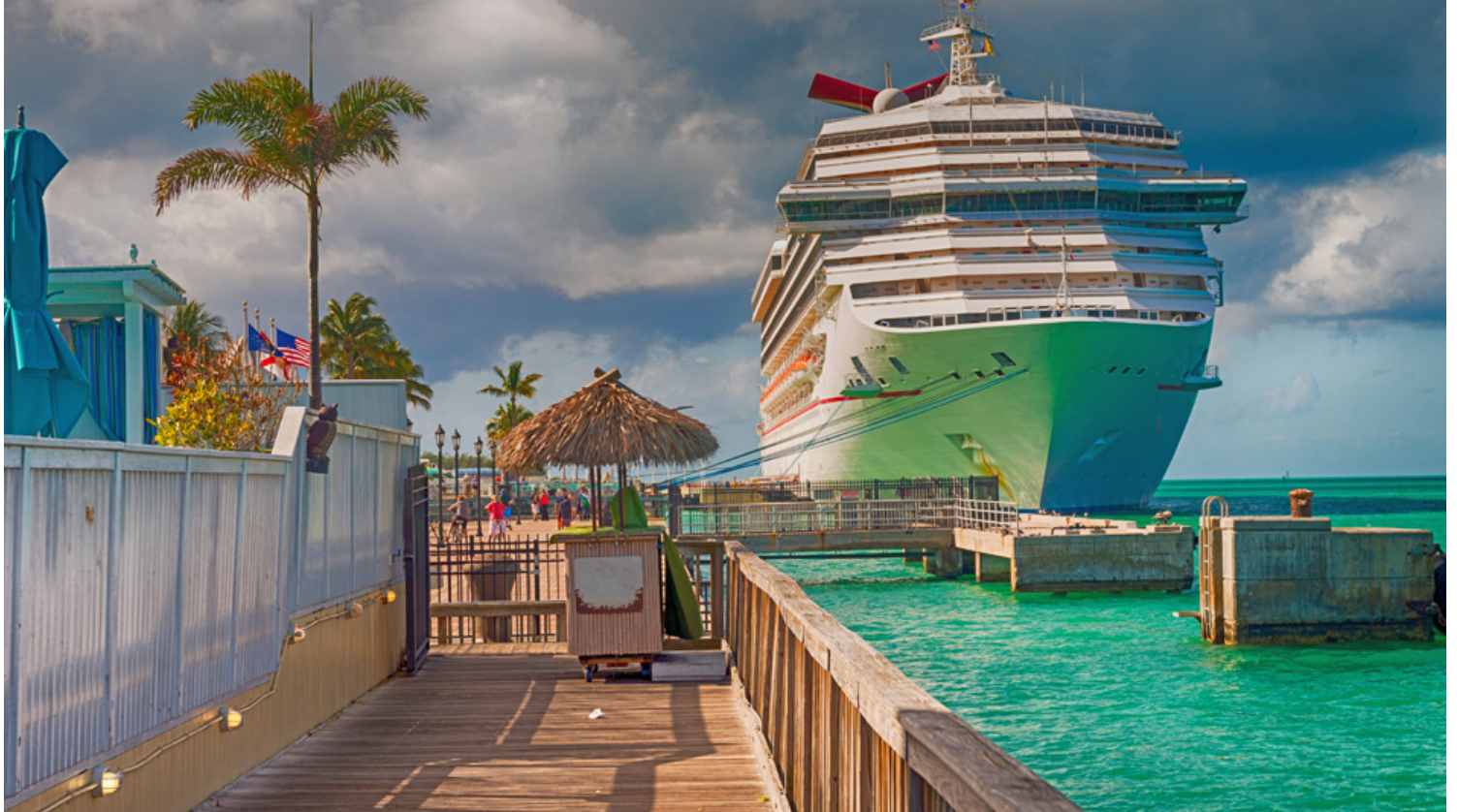
עולם הקרוזים - דוח CLIA.

המגמות המרכזיות לשנת 2019 היו עלייתה של אינסטגרם כמדיה חברתית, חופשות הבריאות שתפסו תאוצה, דרישה לחוויות תרבותיות, טכנולוגיות חכמות (בר ביוני, צמידים), מודעות לאיכות הסביבה, יעדים מיוחדים, דור ה-Z בעלייה, נופשים ועובדים, עלייה במספר הנשים באוניות וחופשות הסולו (לדו"ח המלא)