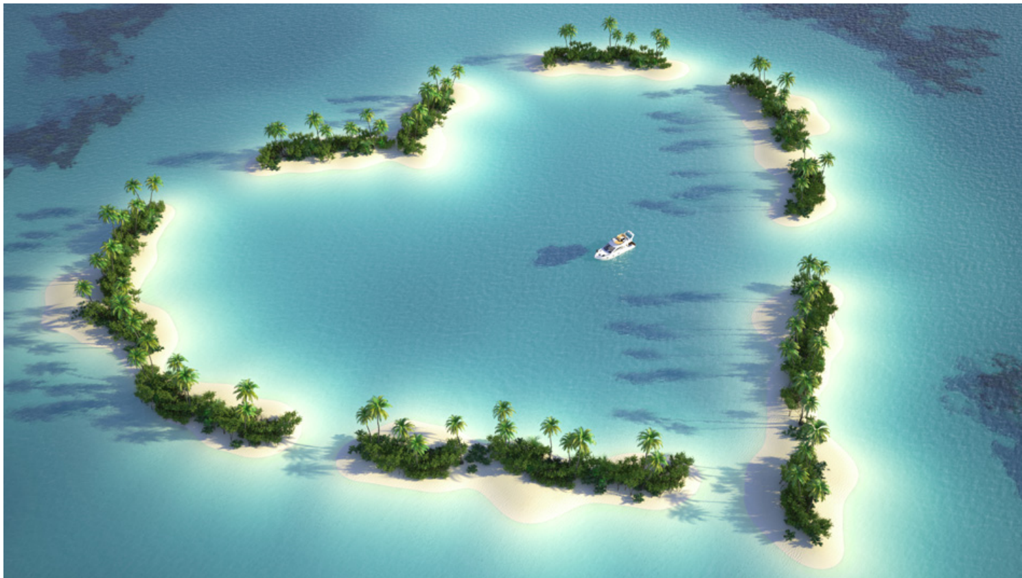
הקאריביים: היעד הפופולארי לחופשות קרוזים.

חדשות וגדולות יותר שנבנו עבור שוק הקרוזים באסיה. דור האוניות החדש יחליף אוניות ישנות שהיו ממוקמות קודם באזור ויחד עם תשתיות משודרגות בכמה מיעדי המפתח יביאו לעליית המודעות. (כתבה מדו"ח אסיה ל-2019)