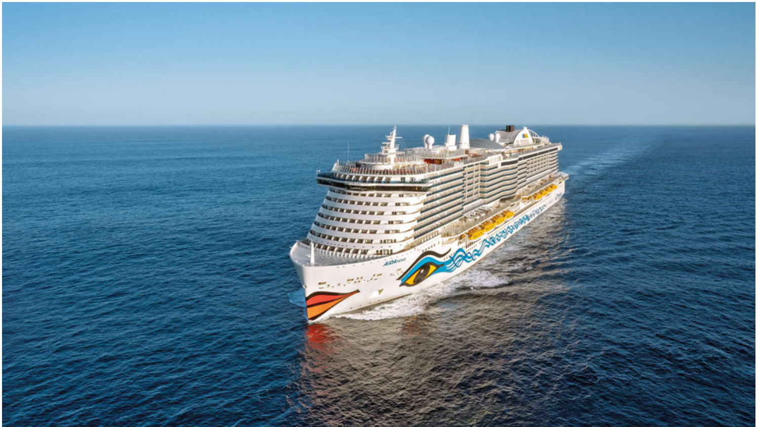
AIDAnova - הראשונה שמונעת באמצעות גז טבעי נוזלי.

Exhaust Gas Cleaning Systems - ECGS (מערכות ניקוי גז פליטה) 68% מהאוניות הפועלות בעולם מפעילות מערכות לניקוי גז פליטה בעוד 75% מהאוניות החדשות שנבנות ללא מערכת גז טבעי נוזלי תיעזרנה במערכת.