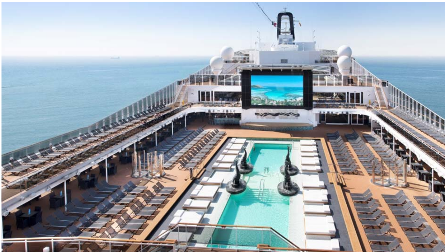
MSC Virtuosa סיפון הבריכה.