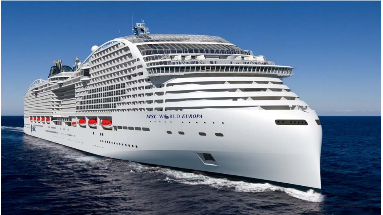
MSC World Europa: האנייה החדשה של MSC Cruises . צילום יח"צ