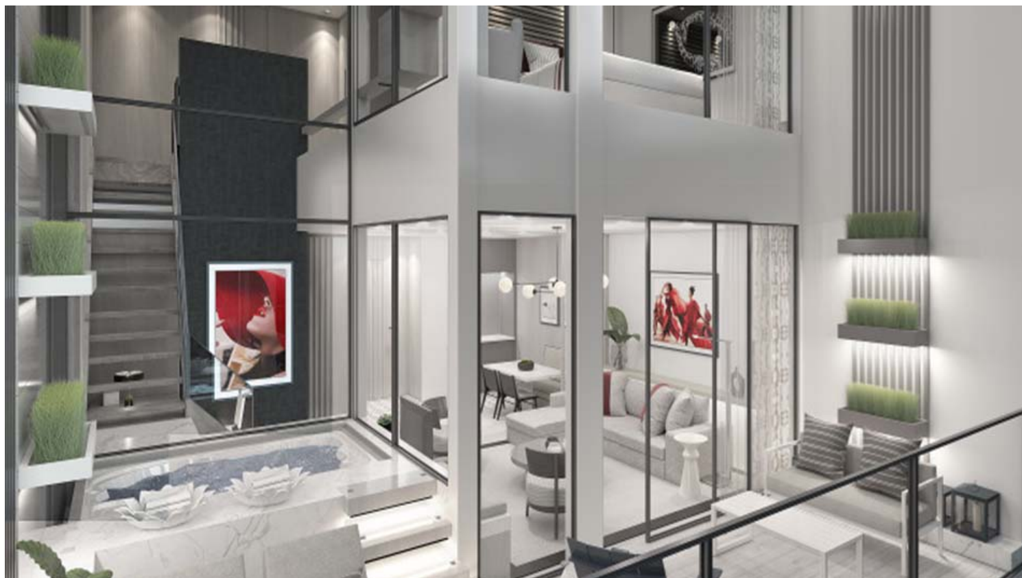
וילות דו קומתיים בגודל 88 מ"ר באונייה Celebrity Beyond.