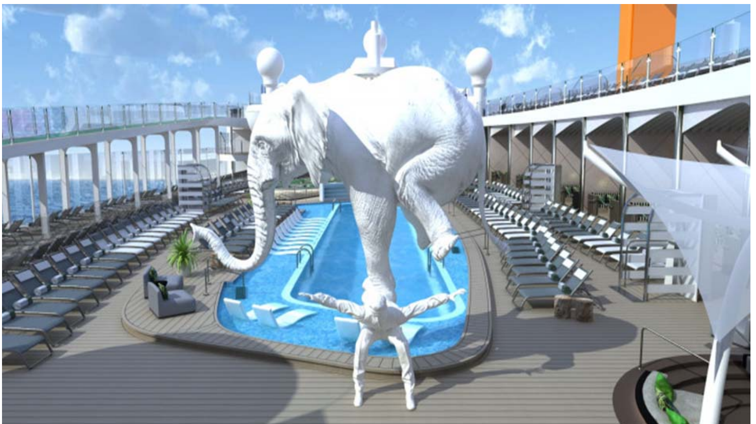
The Resort Deck עם בריכה באורך 22 מטרים באונייה Celebrity Beyond.

Celebrity Beyond לא רק תחזיק בתואר האונייה הגדולה בצי סלבריטי קרוזס, אלא גם בתואר האונייה המפוארת ביותר של מותג היוקרה מבית קבוצת רויאל קריביאן. ניצבת לאורך 17 סיפונים וארוכה ב-21 מטרים מקודמותיה האחרות Celebrity Edge שהושקה ב-2018 ו-Celebrity Apex שהושקה ב-2020.