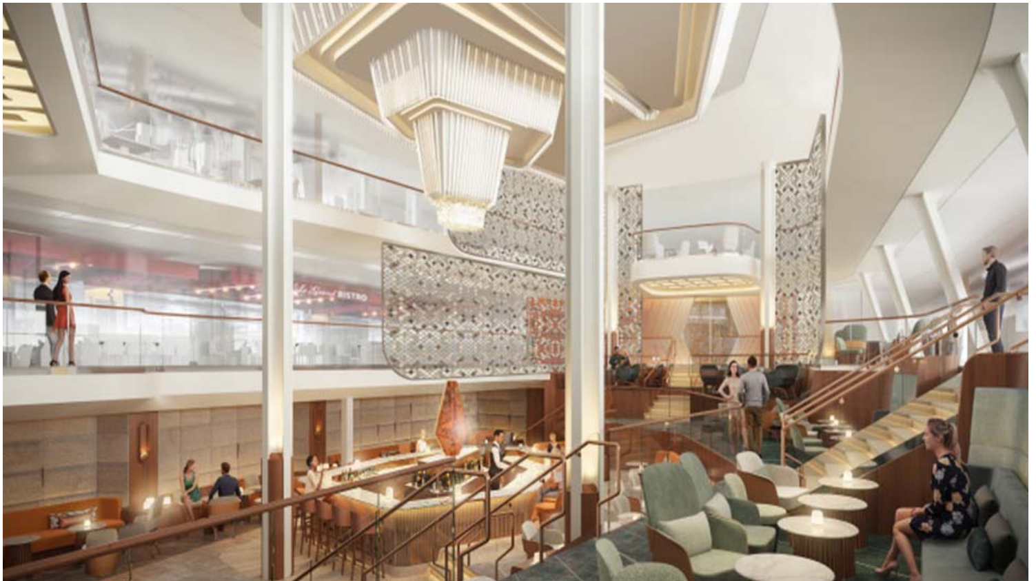
בהשראת הפיאצות של איטליה, ה-Grand Plaza משתרע על שלושה סיפונים בלב האונייה.