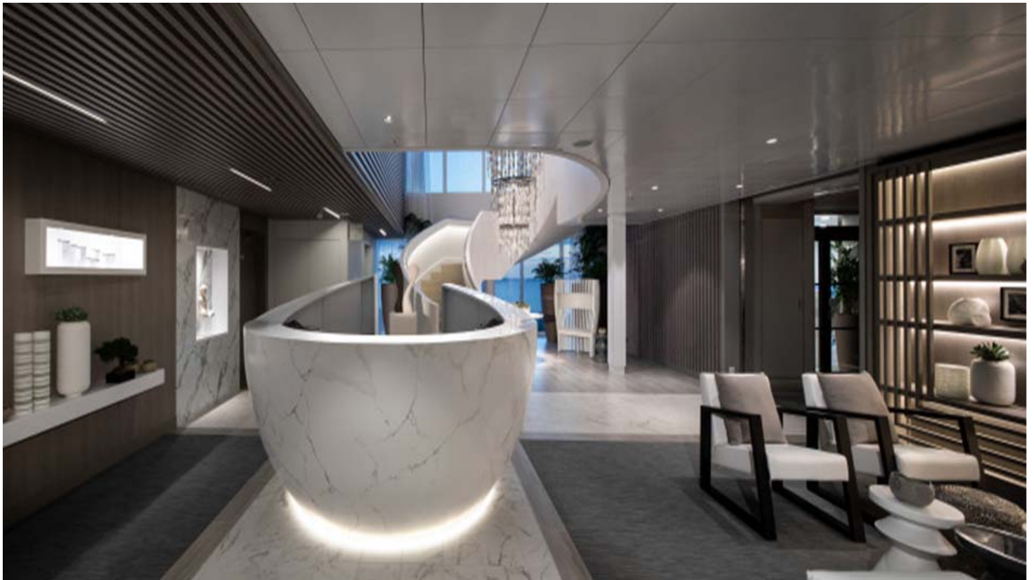
1208 מ"ר של ספא בעיצוב ייחודי המציע 120 סוגי טיפולים. צילום סלבריטי קרוזס