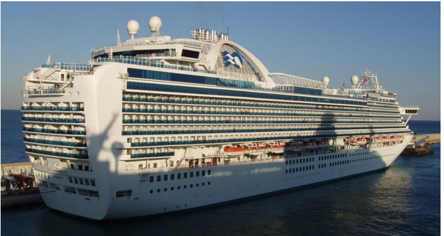
קראון פרינסס

P&O Australia ממשיכה לשמש כמובילת השוק, עם שלוש אוניות הפועלות כל השנה מנמלים באוסטרליה וניו זילנד. צי החברה כולל את Pacific Encounter ואת Pacific Adventure , שהן מהאוניות הגדולות שמשיטות באזור.